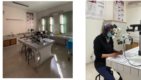
Figure 1 : Laboratoire d'anatomie et Résident en cours de dissection

Le programme est reparti en 7 séances de 3 heures chacune. Les objectifs évoluent à chaque séance, commençant par les acquisitions de base pour finir par les sutures anastomotiques sur rat de laboratoire.