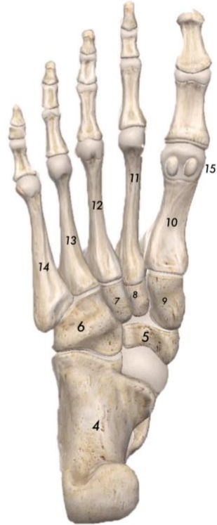
Vue plantaire du squelette du pied